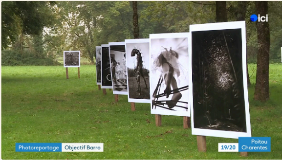
Photoreportage Objectif Barro