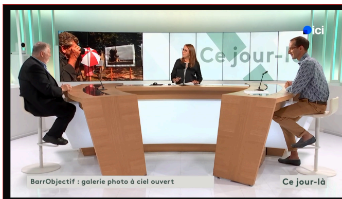
BarrObjectif : galerie photo à ciel ouvert