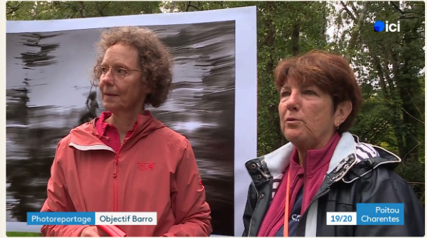
Photoreportage Objectif Barro