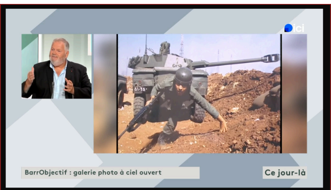
BarrObjectif : galerie photo à ciel ouvert