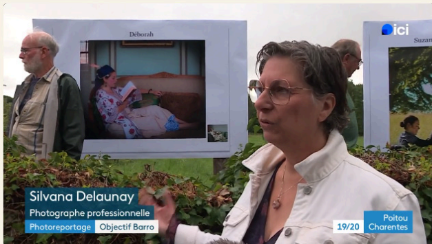
Silvana Delaunay Photographe professionnelle Photoreportage Objectif Barro

diffusé le 12/09/2025 • 31 min • tous publics