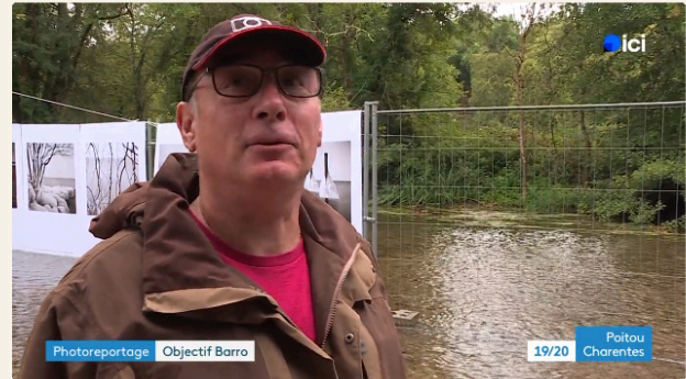
Photoreportage Objectif Barro